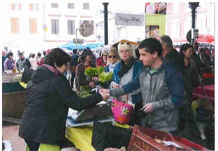
Le marché gourmand

Ponctuer le territoire durant l'été d'une programmation gratuite offrant au public des animations en journée et des concerts en soirée, voici l'ambition des nouveaux rendez-vous Cœur Estival. Coordonnés par la Communauté de Communes Cœur de Garonne et co-organisés par la Maison de la Terre et l'Office de Tourisme Intercommunal, ces moments de rencontre festifs entre public, artistes invités et associations locales, mettront l'accent sur la convivialité et les découvertes artistiques de qualité en Cœur de Garonne. Le programme de l'été 2018 :