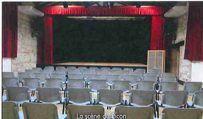
La scène du Picon

Depuis son ouverture en septembre 2017, cette salle n'a pas chômé ; outre les trois séances mensuelles de cinéma au cours desquelles sont projetés un film grand public, un film pour les enfants et un film classé plutôt « Art et Essai », ont été programmés : des soirées théâtrales et des rencontres d'auteurs (« Les culturelles commingeoises » et « Avancez culturel » de Cazères entre autres organisateurs) ; des concerts de jazz et de musique du monde avec « les Musicales d'Automne », « Clarijazz », « la Maison de la Terre », « le Fouss en ré » ; un concert Charles Trenet dans le cadre de « jazz en Comminges » avec la compagnie « Soir et Matin » ; des spectacles pour les enfants et pour les scolaires (Le médecin malgré lui de Molière, les spectacles de Noël avec la compagnie « Pois de senteur » ; des soirées de musique classique ( Quatuor Dolce Vita » « Le Fouss en ré ») et bien d'autres choses encore qu'il serait fastidieux d'énumérer.