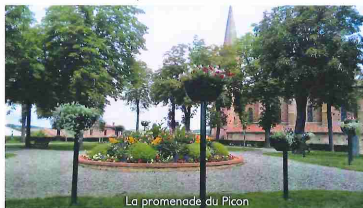
La promenade du Picon

Les travaux continuent sur la promenade du Picon : Les allées ont été bordées et la sabline compactée pour permettre aux personnes à mobilité réduite de se déplacer sans difficulté dans le jardin.