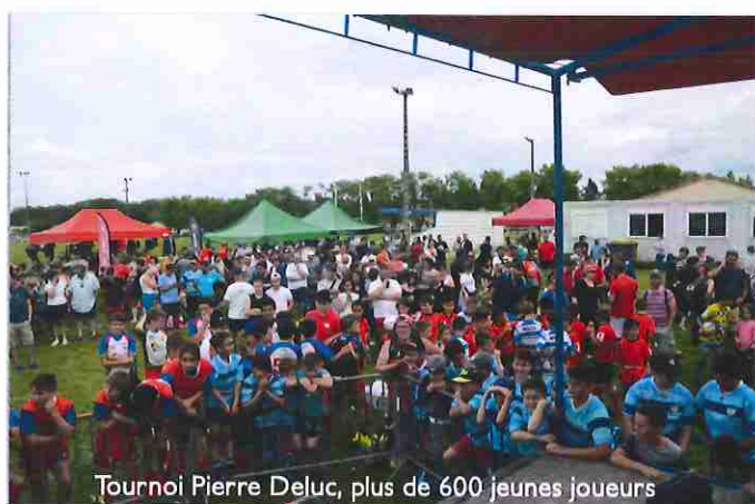
Tournoi Pierre Deluc, plus de 600 jeunes joueurs

L'Ecole de Rugby englobe 140 enfants, avec le 21 avril 2017 l'obtention de la Labellisation de la Fédération Française de Rugby de notre Ecole de Rugby. Ce Label, qui certifie que l'E.D.R. dans son organisation, son fonctionnement et ses objectifs, répond aux critères « Ecole de Rugby : Ecole de la vie » et qu'elle s'inscrit dans un processus permanent d'amélioration.