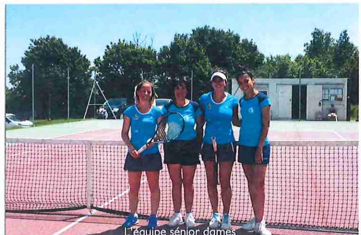
L'équipe sénior dames

Les finales jeunes auront lieu le matin, et les finales adultes l'après-midi. Là encore une réussite puisque 70 inscrits au tournoi interne cette année : 38 jeunes et 32 adultes, dont 42 joueurs classés.