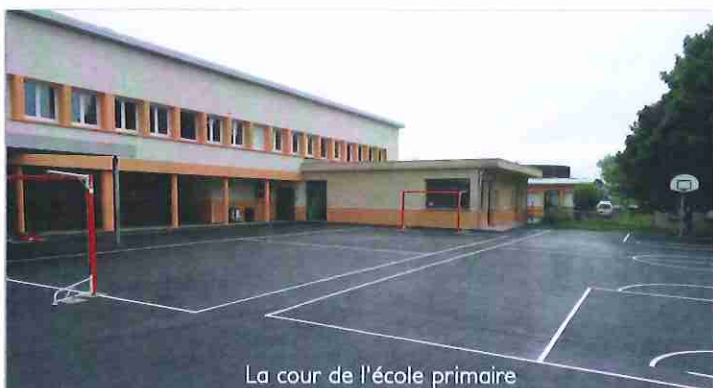
La cour de l'école primaire

Les espaces extérieurs entièrement refaits permettent ainsi aux enfants d'évoluer en sécurité pour leur plus grand plaisir. La rénovation globale de l'école élémentaire est ainsi achevée.